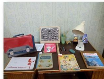
Зал быта и повседневной культуры советского времени