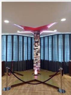
Зал «Герои Отечества»