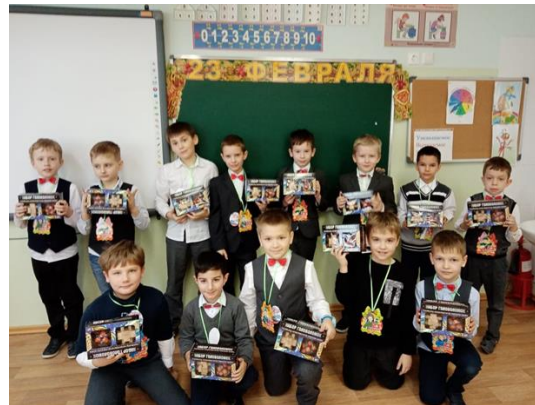
Праздник «День защитника Отечества»