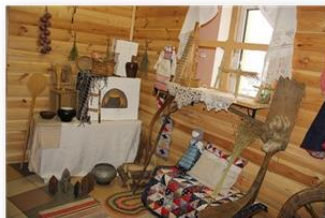
Пространство «Русская изба»