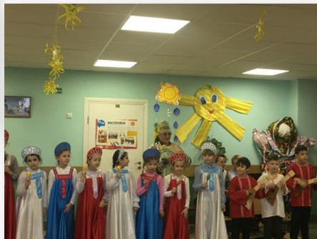
Праздники народного календаря