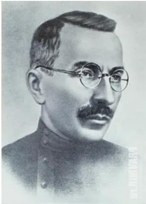
А. С. Макаренко

«Воспитывает все: люди, вещи, явления, но прежде всего и дольше всего — люди. Из них на первом месте — родители и педагоги»