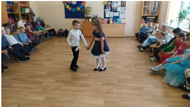
Интерактивная программа «А, ну-ка, девочки!»

Ежедневно 6 часов создания условий для духовно-нравственного развития и социализации младших школьников.