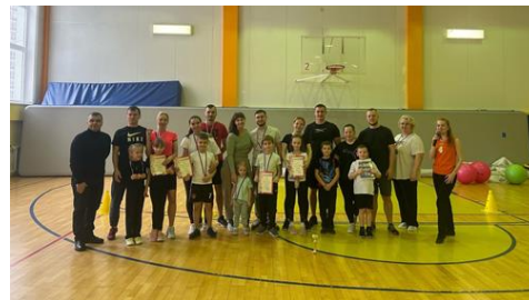
«Папа, мама и Я» спортивные соревнования