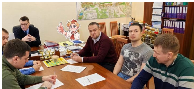
Заседание Совета отцов