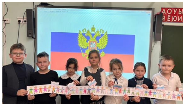
Флешмоб ко Дню народного единства