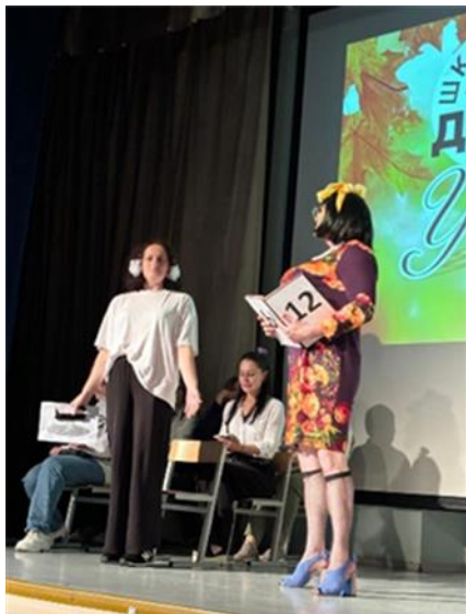
Поздравление от Совета родителей с Днём Учителя