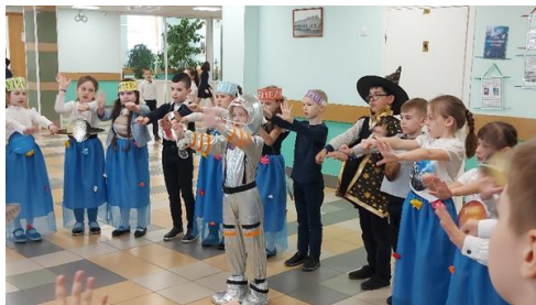
Игровая программа «Первые в космосе»