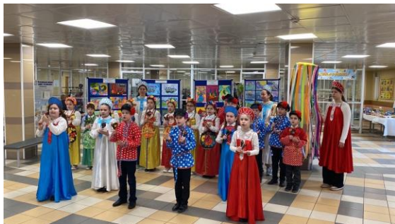
Участие в творческих номерах