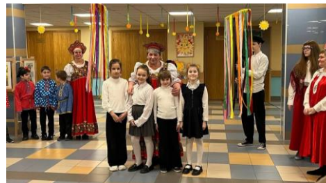
Праздник «Здравствуй, Масленица!»