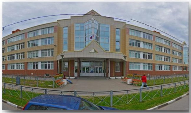
Корпус основной и средней школы – 2011 год