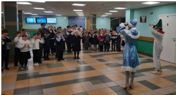
Интерактивная программа «Новогодний фейерверк»